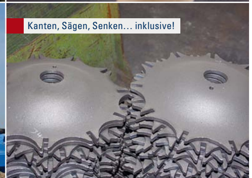
Kanten, Sägen, Senken... inklusive!