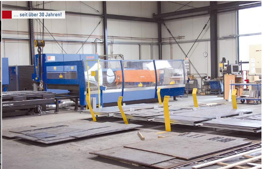
... seit über 30 Jahren!