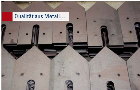
Qualität aus Metall...